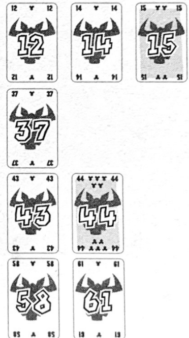
Afb. 2: Zo zien de 4 rijen er uit na de eerste ronde.

Zoals in afbeelding 2 is te zien, hebben de laatste kaarten van de 4 rijen de volgende waarden: 12, 37, 43 en 58. Vier spelers spelen de volgende kaarten uit: 14, 15, 44 en 61. De "14" is de laagste kaart. Deze wordt eerst aan een rij toegevoegd. Volgens regel 1 wordt deze kaart in de eerste rij na de "12" geplaatst. De "15" wordt daar direct naast gelegd. Volgens regel 1 kan de "44" in de eerste, tweede en derde rij worden geplaatst. Nu wordt gekeken naar het kleinste verschil, waardoor de kaart in de derde rij naast de "43" komt te liggen. Om diezelfde reden wordt de "61" in de vierde rij aangelegd.