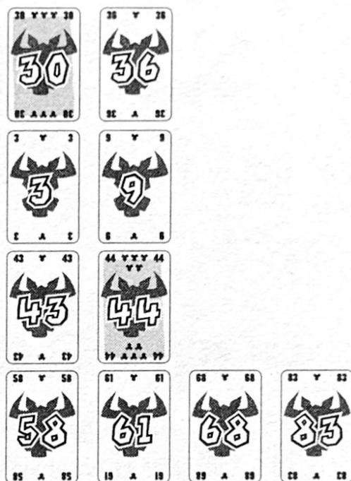
Afb. 4: Zo zien de rijen er uit na de derde ronde

Voorbeeld: De volgende kaarten worden uitgespeeld: 3, 9, 68 en 83. De "3" moet als eerste worden neergelegd. Deze past echter in geen enkele rij. De speler moet nu een rij kiezen, waarvan hij alle kaarten neemt. Hij kiest rij 2 en neemt de "37". Zijn "3" legt hij in de tweede rij. Daardoor legt de speler met de "9" zijn kaart nu naast de "3".