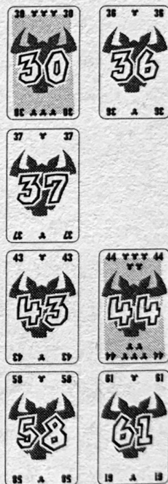
Afb. 3: Zo zien de 4 rijen er uit na de tweede ronde.

De "21" en "26" worden in de eerste rij gelegd die nu met 5 kaarten vol is. De speler die de "30" speelde moet echter zijn kaart ook in deze rij leggen. Omdat dit de zesde kaart is, moet hij de vijf kaarten van de eerste rij pakken. Zijn "30" wordt de eerste kaart van de nieuwe rij. De "36" wordt daarna ook in de eerste rij gelegd, naast de "30".