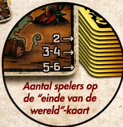
Aantal spelers op de "einde van de wereld"-kaart