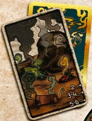
"Einde van de wereld"-kaart